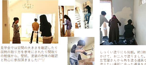
見学会では空間の大きさを確認したり収納の取り方を参考にされたり間取りの勉強から、壁紙、塗装の色味の確認と熱心に参加頂きました(*'*)